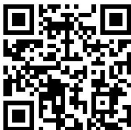
Фото и видео музея. - Текст, изображение: электронные // Темрюкский историкоархеологический музей. – Темрюк. - Обновляется в течении суток. – URL: https://www.culture.ru/institutes/10583/temryukskii-istoriko-arkheologicheskii-muzei (дата обращения: 12.05.2022.).

14. Темрюкский историко-археологический музей. – Темрюк. - Обновляется в течении суток. – URL: https://темрюк-музей.рф/ (дата обращения: 12.05.2022.). – Текст, изображение: электронные.